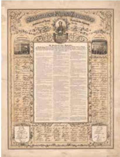
Danmarks Riges Grundlov 1849.

Udviklingen mod det samfund, vi har i 2020, var dermed sat på skinner.